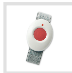
Funk-Druckknopf PNG-FD (optional)