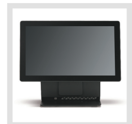
Zentrale PNZ-I3 (optional)