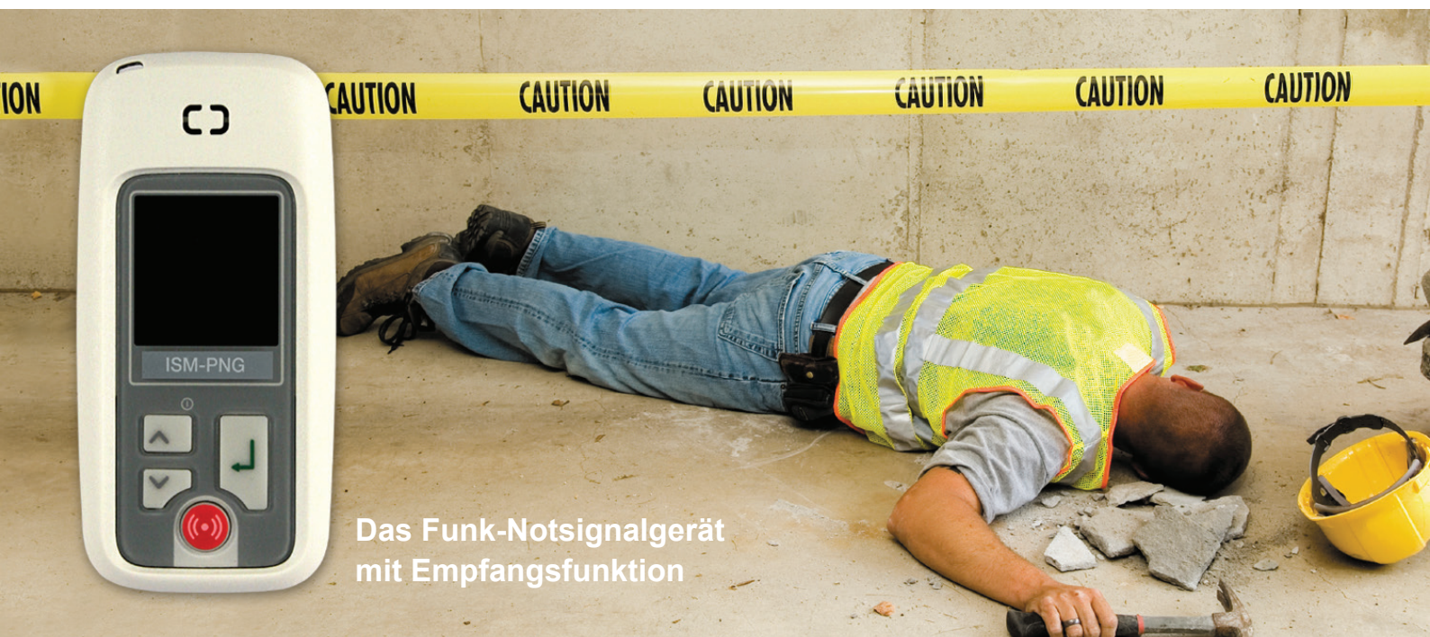
Das Funk-Notsignalgerät mit Empfangsfunktion

ISM 3000/PNA ist gebührenfrei, anmeldfrei und sofort einsetzbar. Das System nutzt speziell den von der EU für Personennotrufe reservierten und störungsfreien Frequenzbereich von 869 MHz.