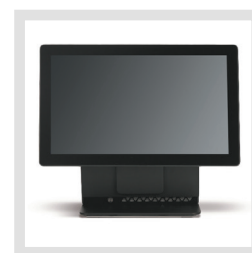
Zentrale PNZ-F1 (optional)